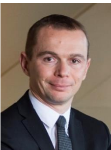
Olivier DUSSOPT Secrétaire d'Etat auprès du Ministre de l'Action et des Comptes publics