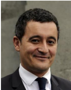
Gérald DARMANIN Ministre de l'Action et des Comptes publics